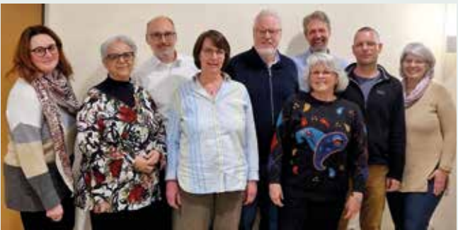
Das Team der Ökumenischen Woche 2026

Zum fünften Mal laden christliche Kirchen und Gemeinden Wetzlars zu einer ökumenischen Woche ein. Wir wollen Räume zur Begegnung öffnen, einander besser kennen lernen, gemeinsam auf Gott und sein Wort hören.