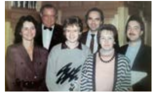
Eines der zahlreichen Orgelkonzerte wurde am 17.11.1991 von sechs Wetzlarer Organisten gestaltet